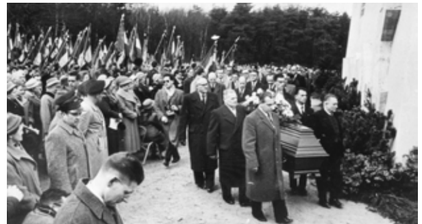
Im neu errichteten Mahnmal in der Bittermark wird 1958 ein französisches NS-Opfer beigesetzt.

Seit dem Ende des Ersten Weltkrieges kam es – wie im ganzen Weimarer Staat – auch in Dortmund zu einem Erstarken von völkischen, nationalsozialistischen und anderen antidemokratischen Bewegungen. Zugleich aber entwickelte sich gerade in Dortmund ein starker Widerstand dagegen, der sich in seinem Kampf für Demokratie, Freiheit und Gleichheit einsetzte. Zwischen 1933 und 1945 wurden linke und demokratische Kräfte vom nationalsozialistischen Staat unterdrückt und verfolgt. Viele Akteure wurden wegen ihrer antifaschistischen Arbeit ermordet.