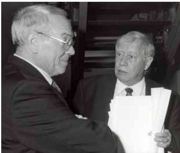
Oberbürgermeister Günter Samtlebe eröffnet gemeinsam mit dem Historiker Hans Mommsen die Steinwache.

Parallel begannen die Bestrebungen vor allem des Jugendrings, das zuletzt als Obdachlosenasyl genutzte und während der NS-Zeit als „Hölle Westdeutschlands“ bekannte ehemalige Polizeigefängnis, die „Steinwache“, vor dem Abriss zu bewahren und zu einem antifaschistischen Gedenk- und Lernort umzuwidmen. 1992 wurde schließlich die Mahn- und Gedenkstätte Steinwache als zentraler Ort der städtischen Auseinandersetzung mit der nationalsozialistischen Verfolgung und dem Widerstand gegen diese eröffnet.