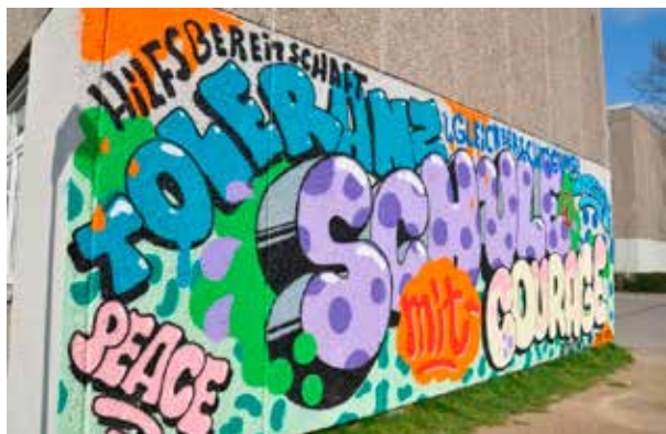
Schule ohne Rassismus – Schule mit Courage