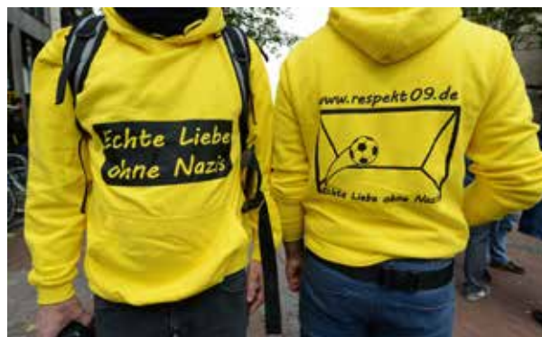
Auch in der Fanszene des BVB wächst das Engagement gegen Rechts.

Doch das Problem neonazistischer Aktivitäten und Gewalt hielt sich hartnäckig. Vor allem ab 1987 entwickelte sich Dortmund zu einem Zentrum von FAP-Aktivitäten, die sich insbesondere auf Lütgendortmund konzentrierten. Dort wurden Mitglieder einer Bürgerinitiative bedroht und angegriffen. Die Arbeit eines örtlichen Jugendheims war vielfach nur noch unter Polizeischutz möglich. Aufgrund der Häufung neonazistischer Straf- und Gewalttaten in Dortmunder Jugendheimen war im Frühjahr 1986 ein antifaschistischer Arbeitskreis entstanden, dem zunächst alle Ratsparteien nebst Jugendorganisationen angehörten. 1987 waren nur noch mehrere Jugendkeller und -freizeitstätten sowie die Falken übrig geblieben, die Mitte Februar 1987 eine „Aktionswoche gegen den Neofaschismus“ veranstalteten, bei der Druck für ein FAP-Verbot aufgebaut, Jugendliche über Faschismus aufgeklärt und regelmäßige Aktionen vorbereitet werden sollten. Als Hauptgefahr sah man die Borussenfront und ihre Attraktivität für Jugendliche, vor allem im Kontext Fußball. In diesem Zusammenhang entstand auch das „Fan-Projekt Dortmund e.V.“, gegründet im September 1987 durch Kommunalpolitiker, Vertreter der Jugend- und Sportverwaltung und Mitarbeiter des BVB 09.